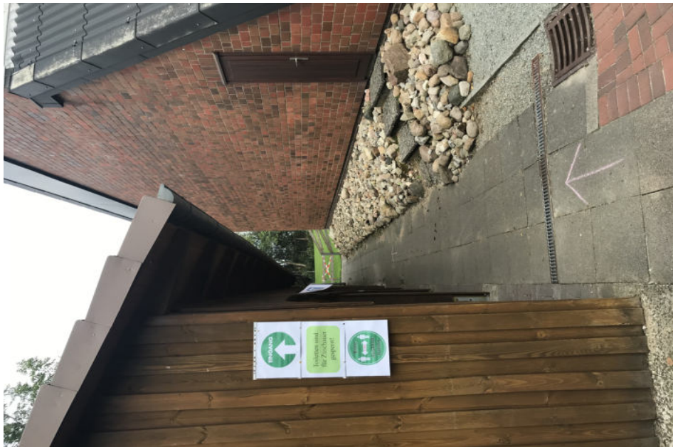
Eingangsbereich der Zuschauer (Beschilderung folgen)