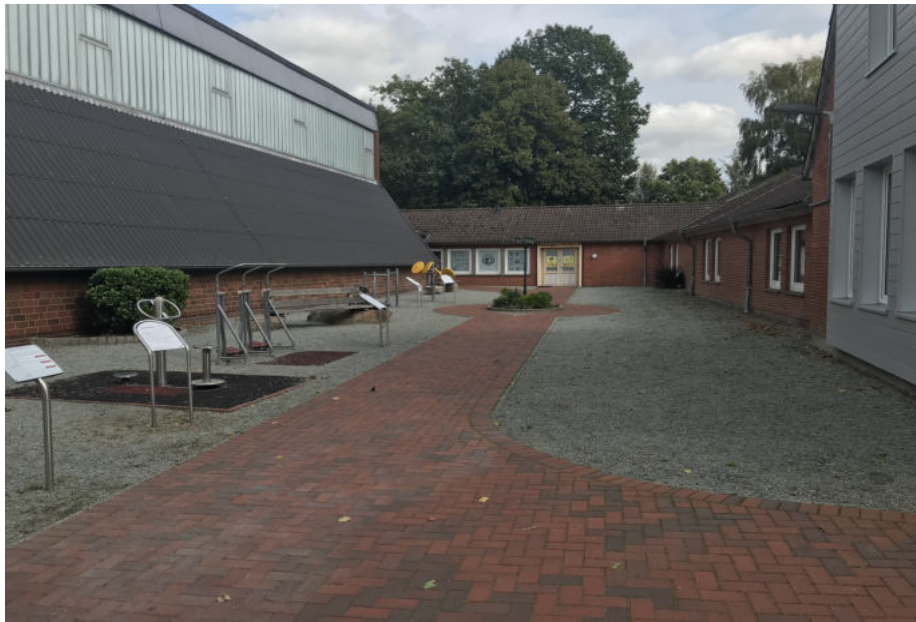
Eingangsbereich der Sportler (Beschilderung ist zu folgen)