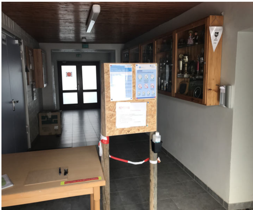
Im Spielertunnel (Zugangsbereich der Kabinen) befindet sich zusätzlich eine Desinfektionsstation