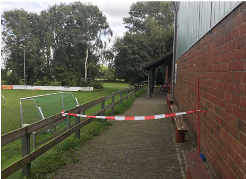
Absperrung der Zuschauer und Sportlern