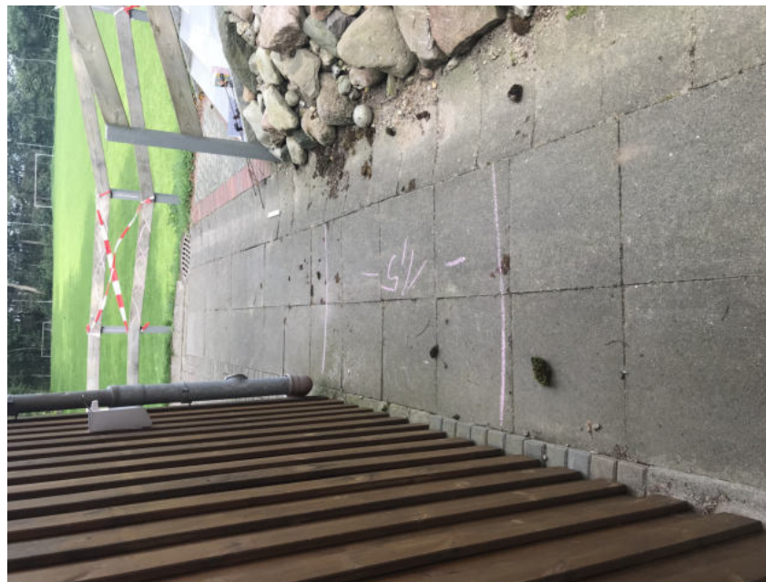
Abstandmarkierungen auf dem Fußboden im Eingangsbereich und Händedesinfektion am Kassierbereich